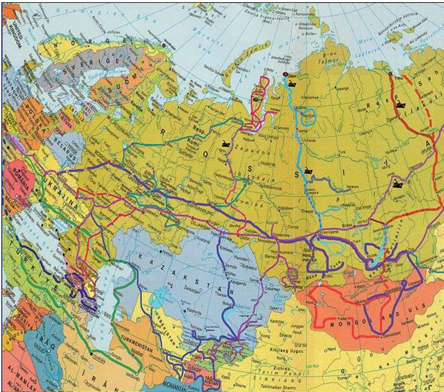
Ilustrace z mé knihy Přes Čukotku na Fidži a zpět 2 (ISBN 978-80-8236-016-8)